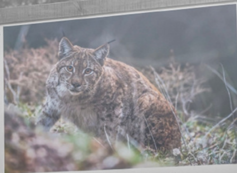
«Face à Face» par Nicolas Goffai (Lynx Boréal du Haut Doubs)